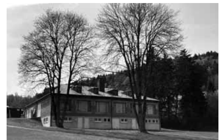
Wo heute noch Bretter die Fensteraus-schnitte bedecken, werden die Saunagäste den Blick in die Landschaft schweifen lassen können.