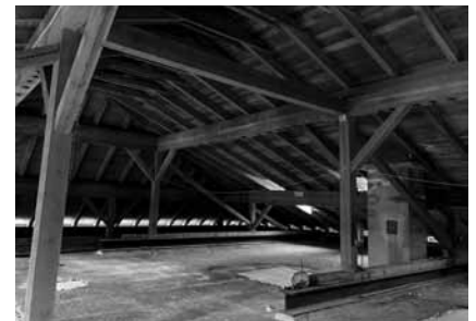
Das Dachgeschoss bekommt Lichtaus-schnitte – hier sind die Ruheräume angesiedelt.